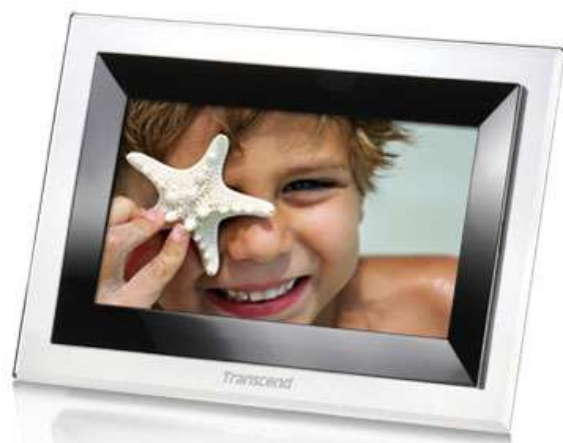
デジタルフォトフレーム トランセンド T.photo 710 流通価格 ¥9,000-