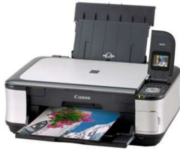
複合機プリンタ CanonMP550 流通価格 ¥18,000-