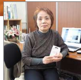
フラッシュメモリ エレコム LUIRE(ルイール) 4G 流通価格 ¥2,000-